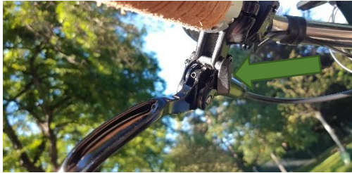
Gelöst, kleiner Hebel gegen Uhrzeigersinn gedreht