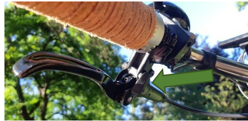
Angezogen, kleiner Hebel im Uhrzeigersinn gedreht